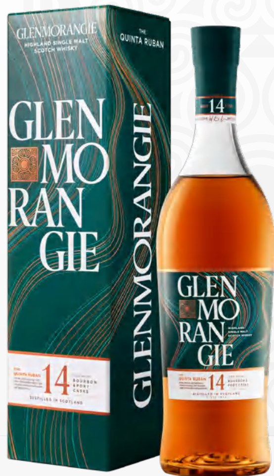
Glenmorangie Quinta Ruban 14 Y.O. 70 cl Astucciato