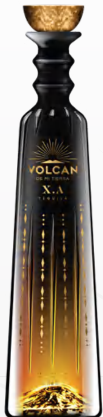
Volcán XA 70 cl Luminous