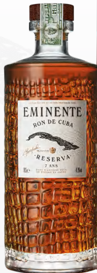
Eminente Reserva 7 años 70 cl Giftbox End of Year