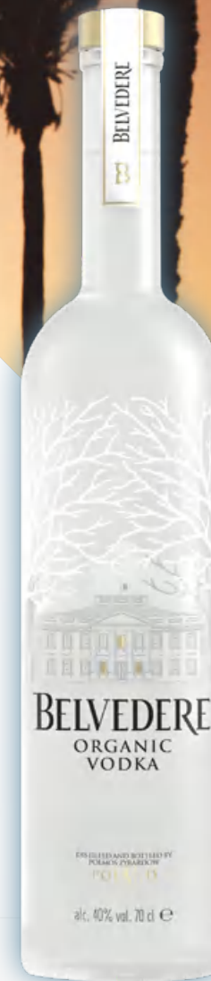
Belvedere Organic Vodka Mathusalem 6 litri Luminous