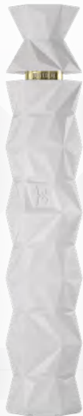
Belvedere 10 70 cl Luminous