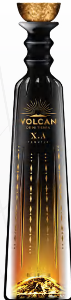
Volcán X.A Magnum 1,75 litri Luminous