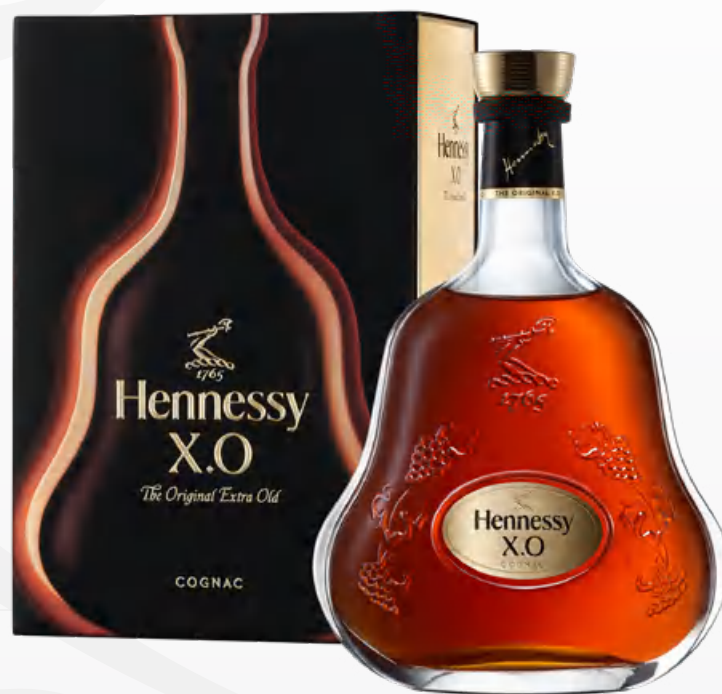
Hennessy X.O 70 cl Astucciato