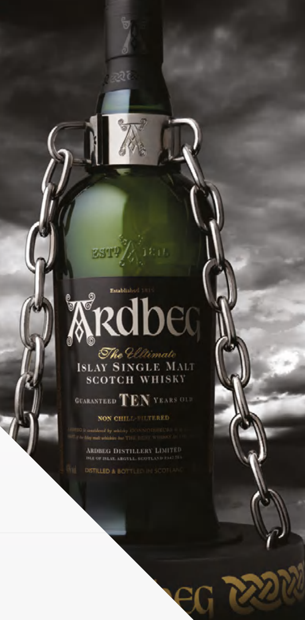
Ardbeg 10 Y.O. 70 cl Astucciato