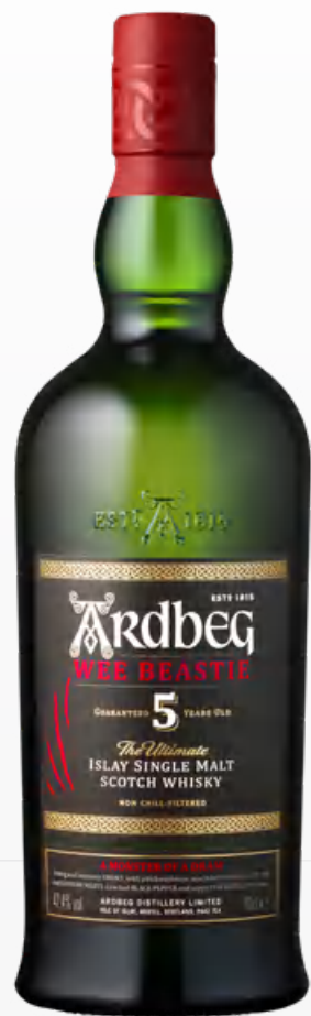
Ardbeg Wee Beastie 5 Y.O. 70 cl