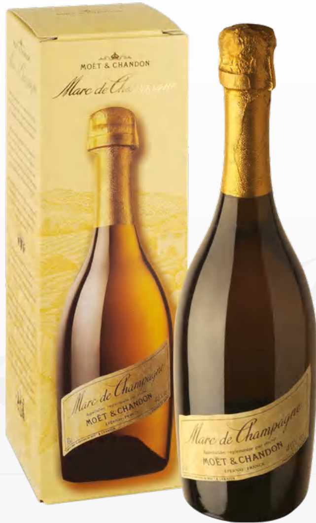
Marc de Champagne Astucciato