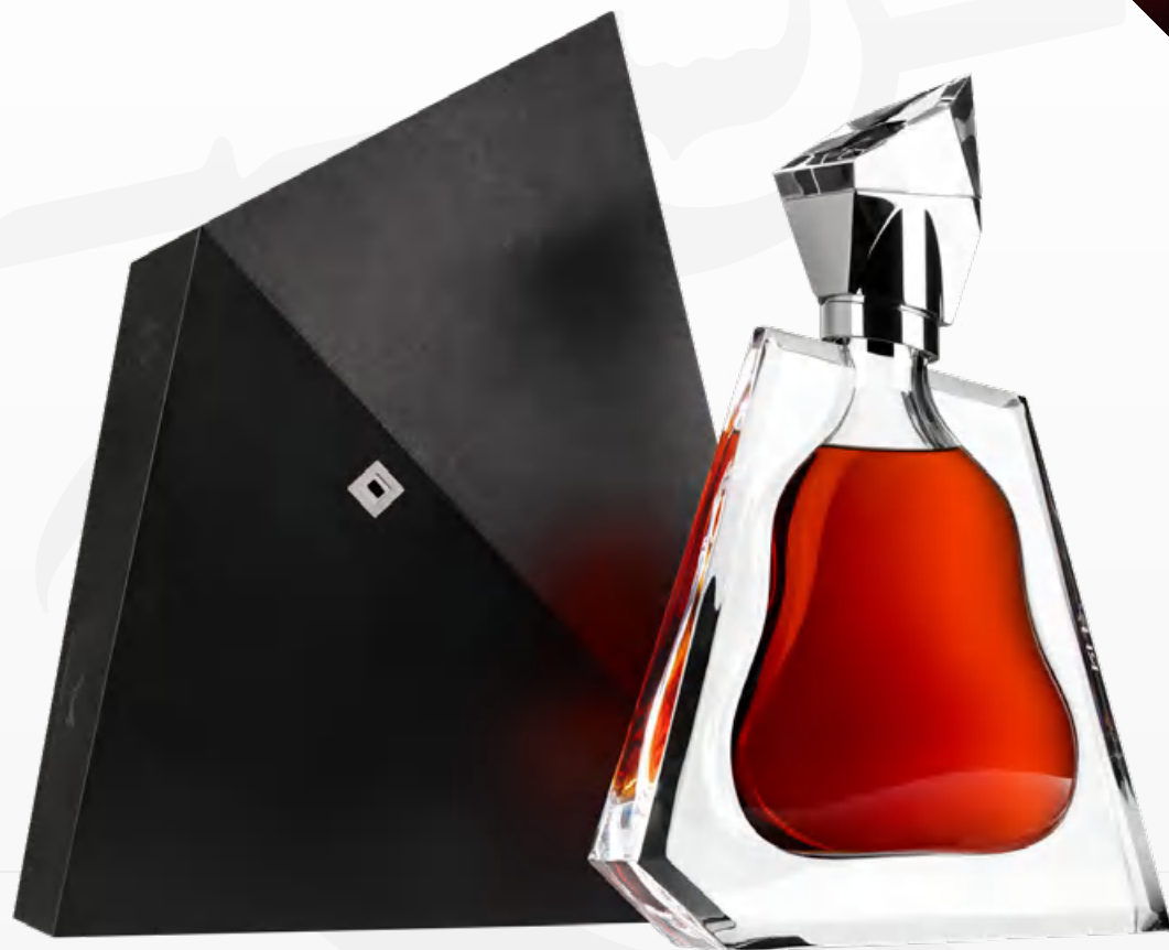
Richard Hennessy 70 cl Astucciato *