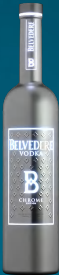
Belvedere Vodka Chrome 70 cl