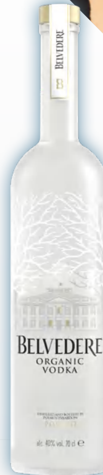
Belvedere Organic Vodka Jéroboam 3 litri Luminous