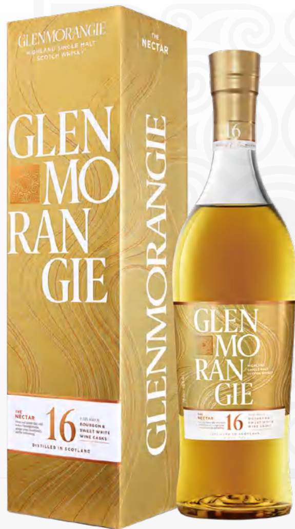
Glenmorangie The Nectar 16 Y.O. 70 cl Astucciato