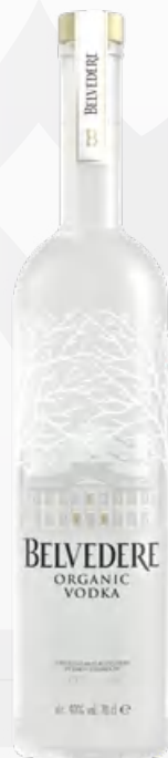
Belvedere Organic Vodka 70 cl