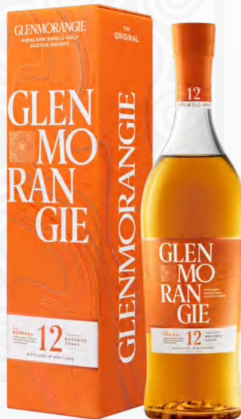
Glenmorangie The Original 12 Y.O. 70 cl Astucciato