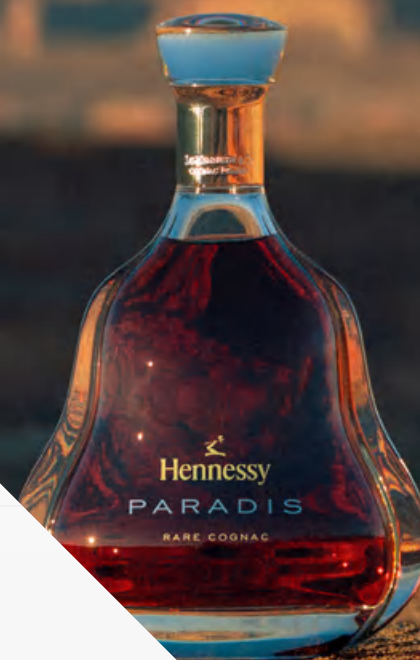
Hennessy Paradis 70 cl Astucciato *