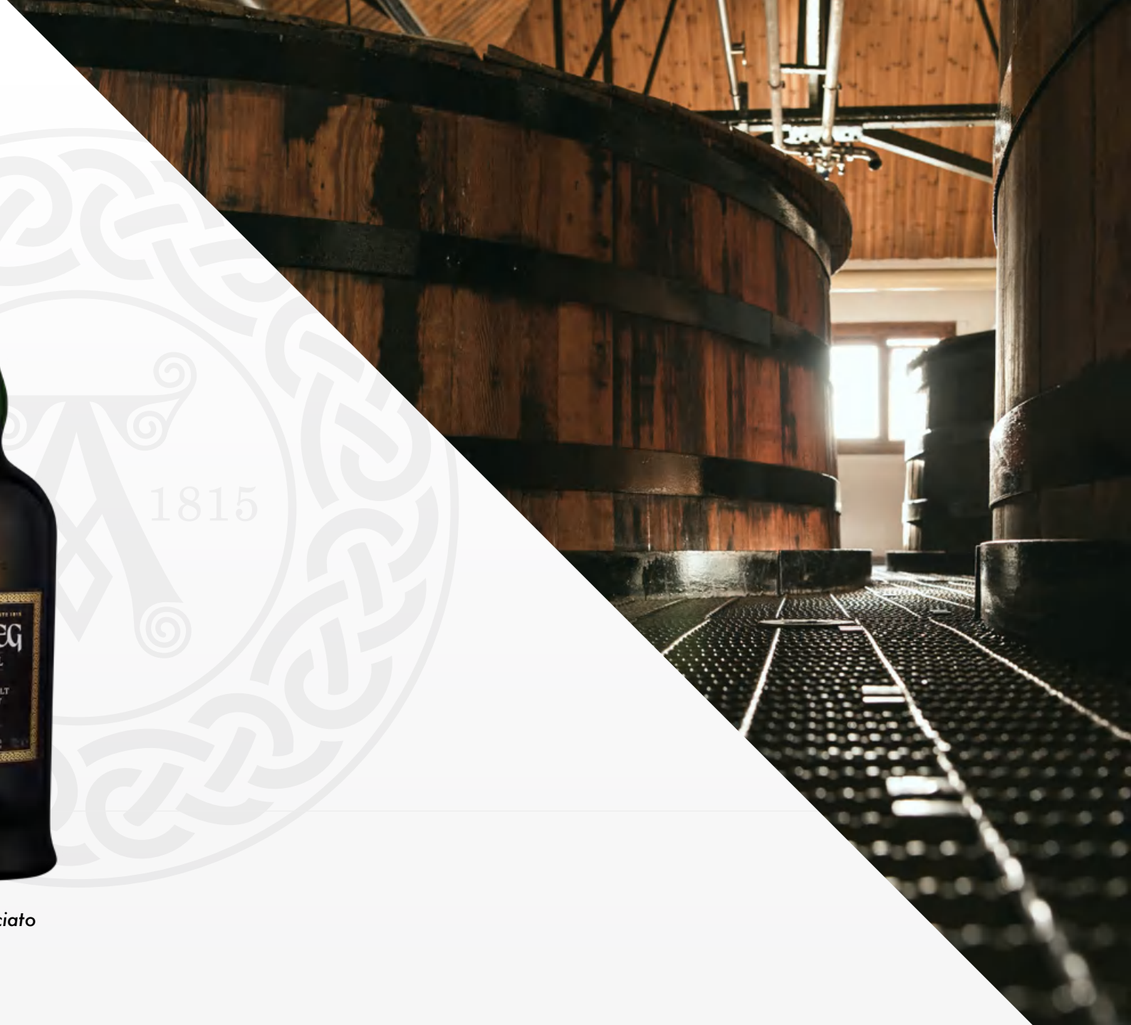
Ardbeg Uigeadail 70 cl Astucciato