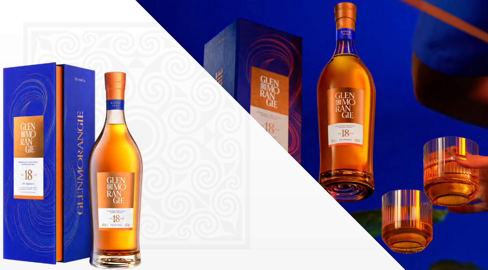
Glenmorangie The Infinita 18 Y.O. 70 cl Astucciato