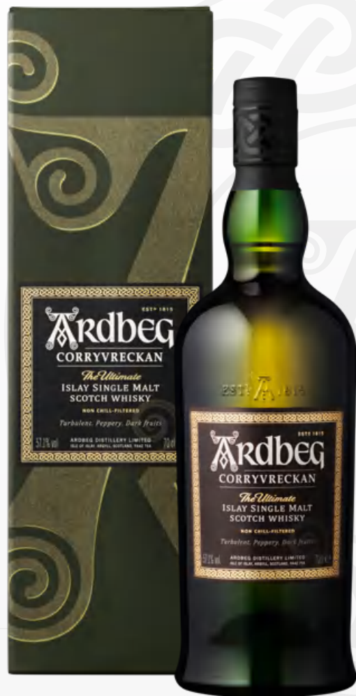
Ardbeg Corryvreckan 70 cl Astucciato