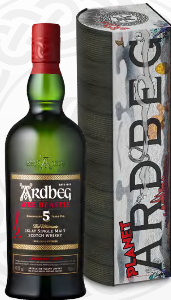
Ardbeg Wee Beastie 5 Y.O. 70 cl Warehouse Pack