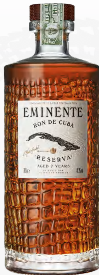
Eminente Reserva 7 años 70 cl