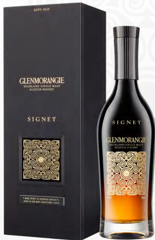
Glenmorangie Signet 70 cl Astucciato*