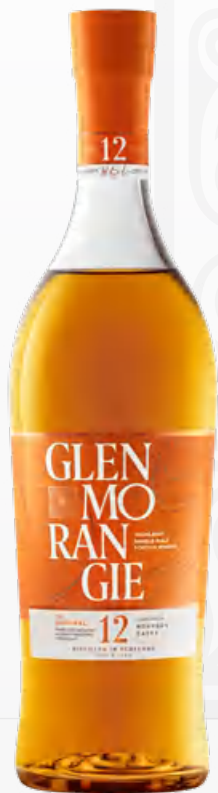
Glenmorangie The Original 12 Y.O. 70 cl