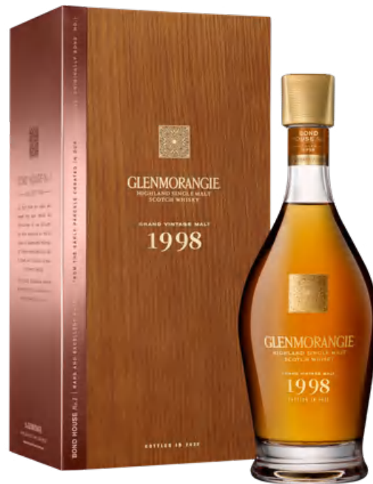
Glenmorangie Grand Vintage Malt 1998 70 cl*

La Bond House No.1 Collection prende il nome dal più grande e antico magazzino di Glenmorangie costruito nel XIX secolo. Questo magazzino è stato il luogo di origine della maturazione in botte dei migliori single malt fino al 1990 ed oggi è definito “La Cattedrale delle Highlands”.