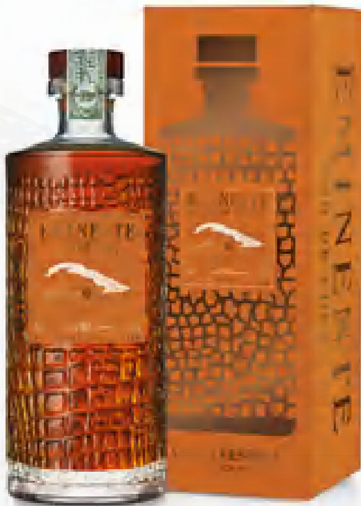
Eminente Gran Reserva 10 años Edition N°2 70 cl Giftbox End of Year