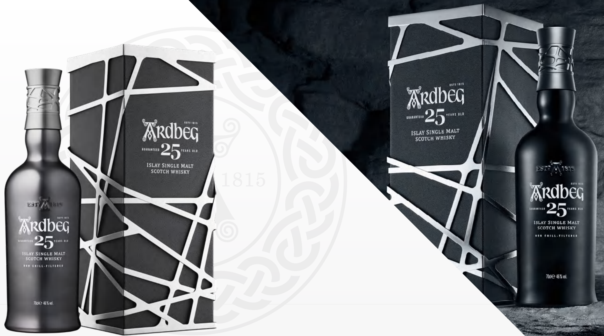
Ardbeg 25 Y.O. 70 cl Astucciato