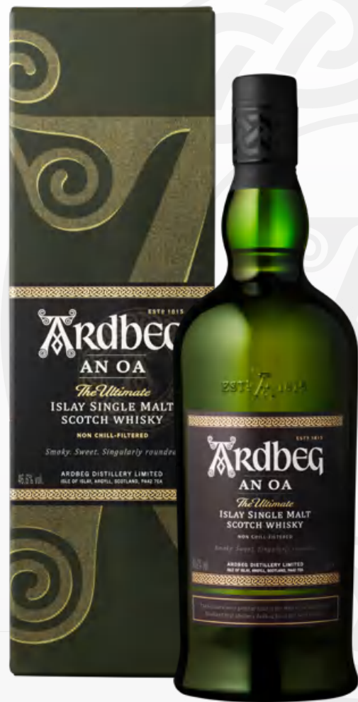
Ardbeg An Oa 70 cl Astucciato