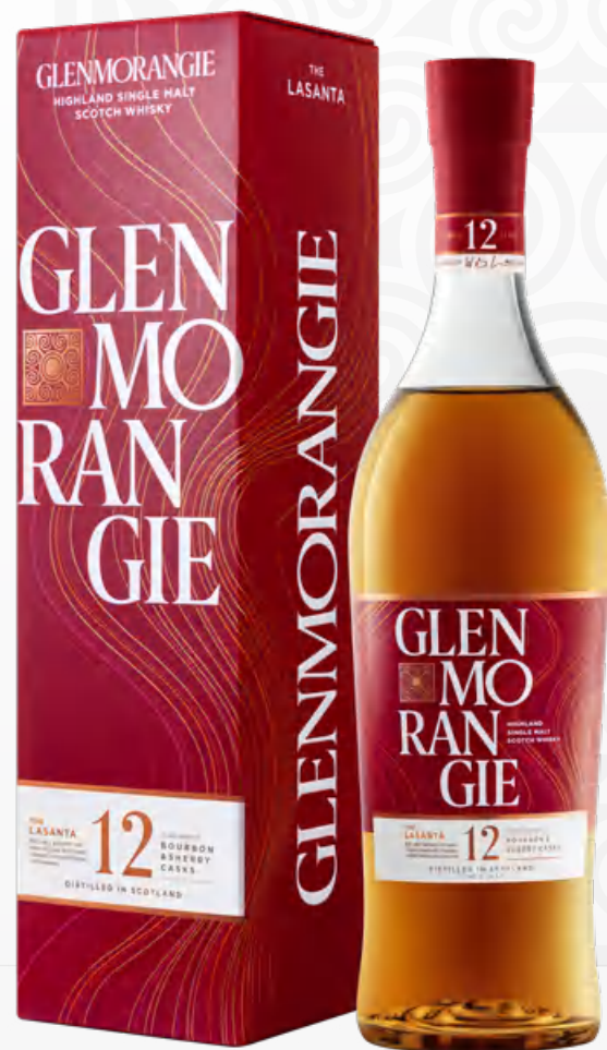
Glenmorangie Lasanta 12 Y.O. 70 cl Astucciato