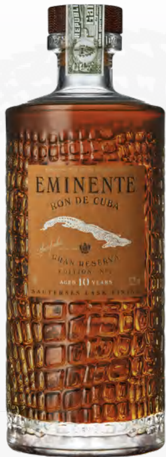
Eminente Gran Reserva 10 años Edition N°2 70 cl