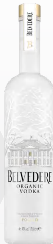
Belvedere Organic Vodka Magnum 1,75 litri