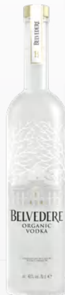
Belvedere Organic Vodka 50 cl