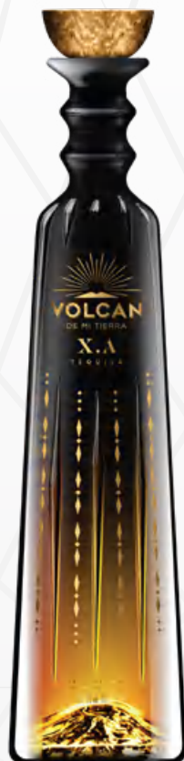
Volcán X.A High Energy Luminous