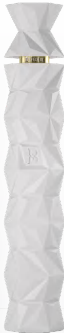
Belvedere 10 Magnum 1,75 litri Luminous