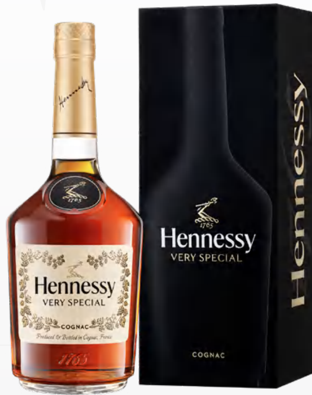
Hennessy V.S 70 cl Astucciato