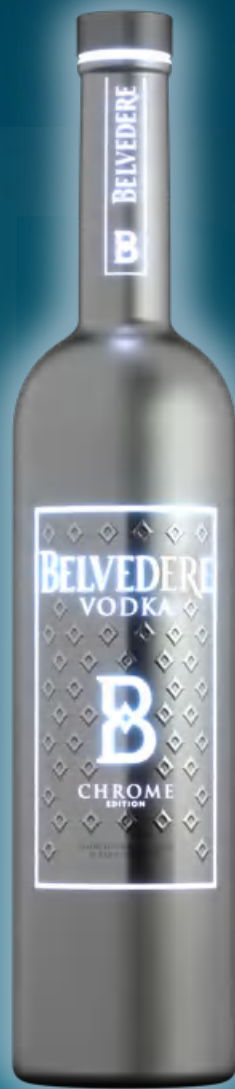
Belvedere Vodka Chrome Magnum 1,75 litri Luminous