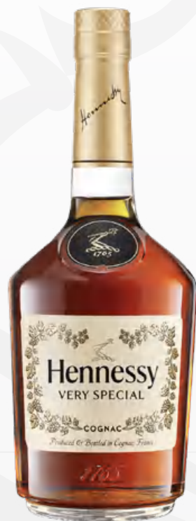
Hennessy V.S 70 cl